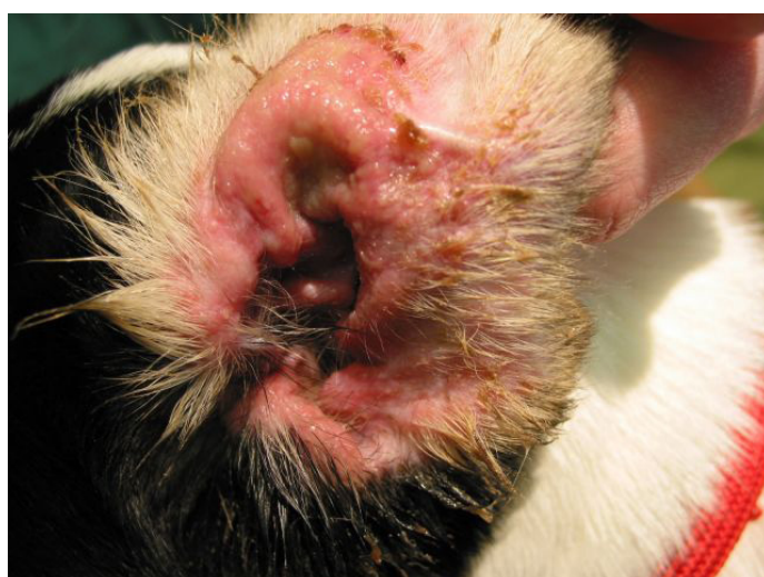
Akut öroninflammation, sekret från hörselgången.