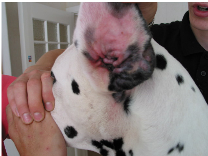
Allergisk öroninflammation, rodnad och varm öronlapp.

I bästa fall kan den externa otiten behandlas enbart med hjälp av koksaltlösning eller öronrens. Öronrens finns i många olika märken och varianter och är en vätska som löser upp vax och smuts och skapar en otrivsamt miljö för svamp och bakterier. Det finns